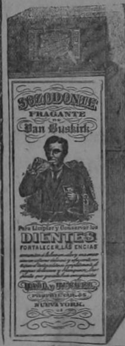
Esta es la figura exacta del paquete según se vende.

HALL & RUCKEL, 215 Washington St. New York, EE. UU. de A.